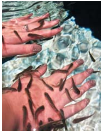
Egzotiškos žuvytės, atkeliavusios net iš Tailando, atlieka mikromasažą, šalina negyvas odos ląsteles, o procedūra ypač tinka tiems kuriems šyla galūnės.